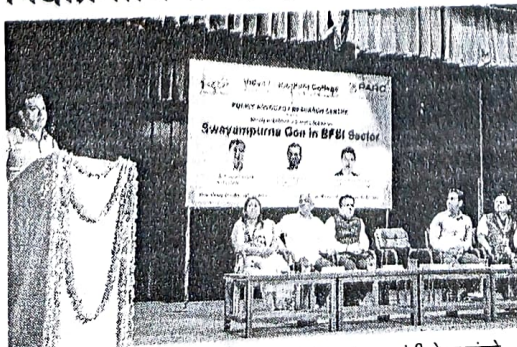
विद्याप्रबोधिनीच्या कार्यक्रमात बोलताना माहिती व तंत्रज्ञान मंत्री रोहन खंवटे.

लोकांमत न्यूज नेटवर्क पणजी : पदव्युत्तर झाल्यानंतर सर्वांना सरकारी पदे पाहिजे. कुणालाही आपले स्वतःचे काही वेगळे तयार करायचे नसते, या मानसिकतेमुळे आम्ही कुठेतरी मागे राहत आहोत. प्रत्येकाकडे वेगळे कौशल्य आहे. सरकारी नोकरीच्या मागे न धावता या कौशल्याचा उपयोग आपले वेगळे अस्तित्व तयार करण्यासाठी वापरावे. उद्योग, माहिती आणि तंत्रज्ञान या क्षेत्रात आज असंख्य संधी उपलब्ध आहे. या संधीचा पुरेपूर उपयोग करून युवकांनी स्वयंपूर्ण बनण्यावर भर द्यावा,' असे प्रतिपादन माहिती आणि तंत्रज्ञान मंत्री रोहन खंवटे यांनी केले.