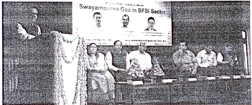
BSE managing director and CEO Ashishkumar Chauhan, speaking at a function of Vidya Prabodhini College of Commerce, Education and Computer Management, Porvorim.

"BPOs serve Indian as well as international countries. Large portion of the world's back office work of banks, insurance and retail companies is run from India. BPOs will provide employment to the scores of Goan commerce graduates who pass out of the local colleges," said Chauhan, in his key-note address at a function organised by Vidya Prabodhini College