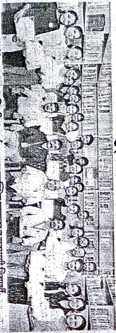
पदरी : प्रमाणपत्र वितरित कार्यक्रमाला उपस्थित मान्यवर व सहभागी विद्यार्थी.