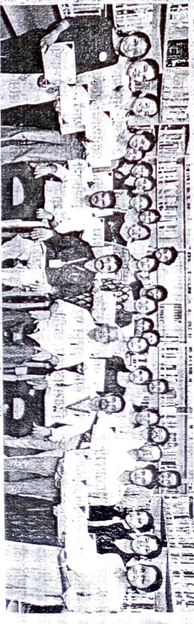
पदरी विद्याप्रबोधिनीत लायब्ररी सायन्स अभ्यासक्रमात सहभागी विद्यार्थ्यांसमवेत मान्यवर.